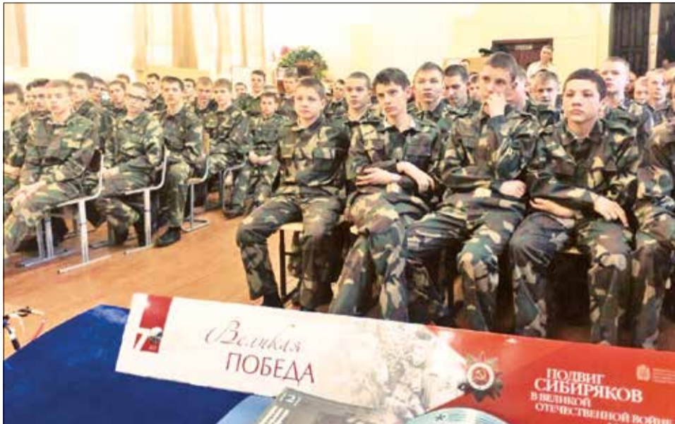
Уроки патриотизма в Канском кадетском корпусе