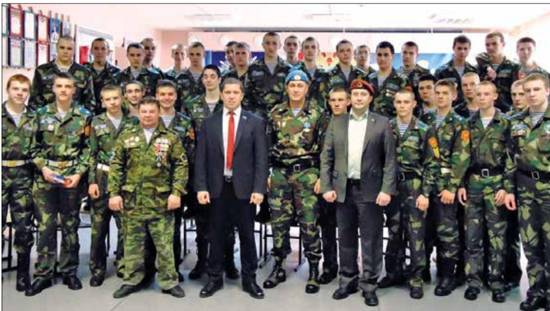
Встреча в Шарыповском кадетском корпусе