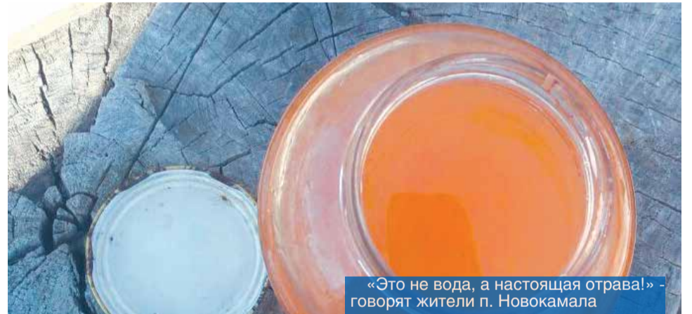
«Это не вода, а настоящая отравка!» - говорят жители п. Новокамала

Проблема с качеством воды знакома жителям многих территорий Красноярского края. Но в некоторых населенных пунктах, особенно небольших, ситуация катастрофическая - под угрозой здоровье жителей.