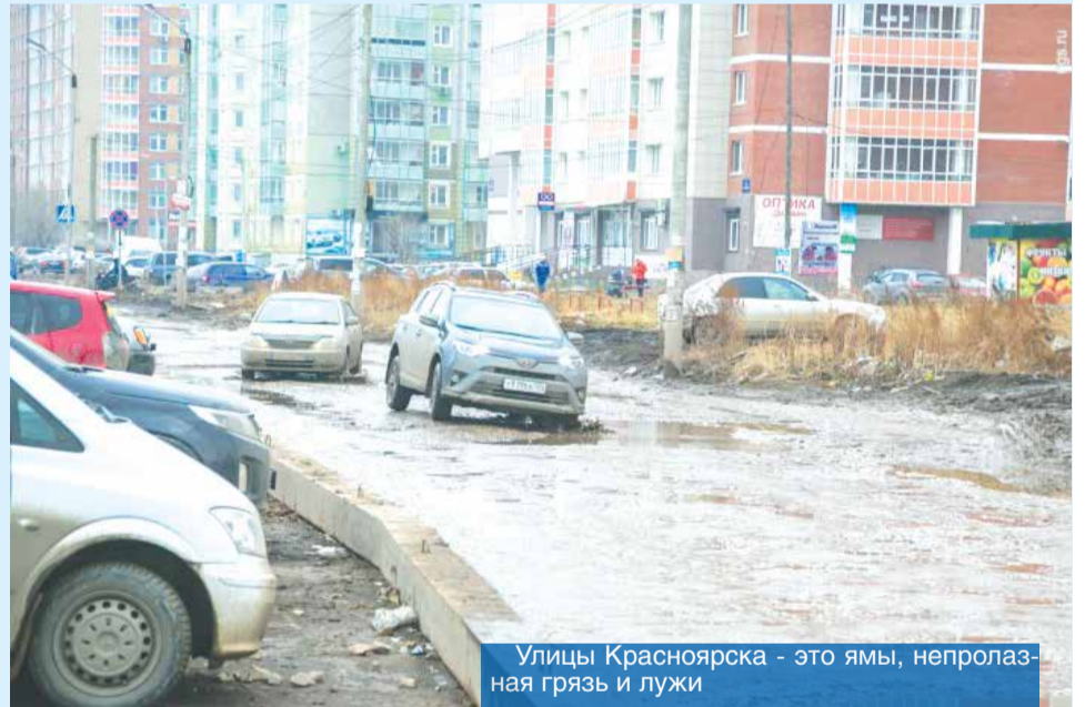
Улицы Красноярска - это ямы, непролазная грязь и лужи

проекты, широко распиаренные администрацией, провалились: генплан — тысяча ошибок, исторического квартала нет, платные парковки — бесконечный позор и стыд, Схему теплоснабжения переделывали три раза, муниципальные предприятия еле сводят концы с концами, кругом обманутые дольщики, собак не могут отловить... Ваше отношение к горхозьям в столице края?» - обратился депутат к губернатору, который признал, что в работе городской администрации есть «вопиющие» проблемы.