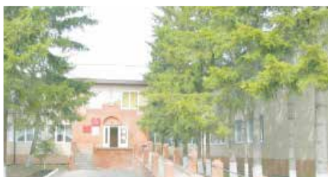
Льготникам Советского района приходится мотаться по четырем адресам

Уже третий год соцзащиту Советского района Красноярска лихорадит. Из удобного здания, в котором имелась большая приёмная для посетителей, сотрудников переселили в четыре разных помещения. Причиной стала всего одна свая, давшая трещину. При этом основной поток посетителей направляется в отдел на