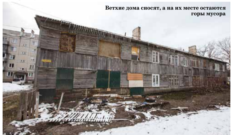
Ветхие дома сносят, а на их месте остаются горы мусора

А пока, все на что хватает способностей назаровских чиновников – расширять кладбище.