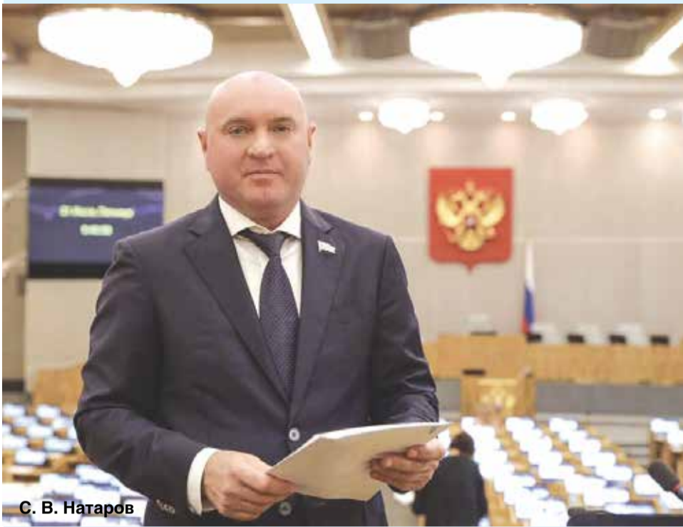
С. В. Натаров

30 июля вступил в силу закон, по которому собственникам квартир дан выбор, как платить за общедомовые нужды. Если в доме есть счетчики, то платежи на общедомовые нужды (ОДН) можно считать по ним. Это зачастую существенно снижает размер платежей. Одним из авторов этого закона, защищающего права жильцов многоквартирных домов стал депутат Госдумы от Красноярского края Сергей НАТАРОВ.