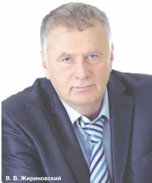
В. В. Жириновский

Согласно последнему опросу Всероссийского центра изучения общественного мнения (ВЦИОМ), в России появился новый тренд – жители страны все больше хотят перемен, а не стабильности. Лидер ЛДПР убежден, что подобное желание закономерно и его можно только приветствовать.