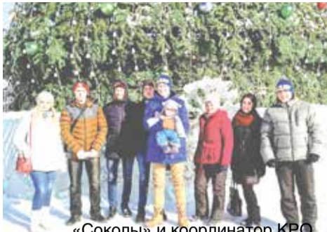
«Соколы» и координатор КРО

Активисты молодежного крыла Красноярского регионального отделения ЛДПР за первые два месяца 2017 года уже успели провести несколько десятков акций и мероприятий