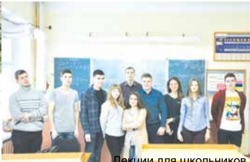
Лекции для школьников