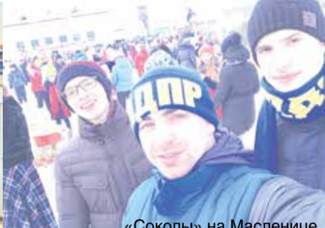
«Соколы» на Масленице

«Соколы» активно реализуют проект «Карта проблем города Красноярска». Уже обследованы два района города – Октябрьский и Советский. Выявлены десятки проблемных мест (разрушенные элементы благоустройства, отсутствие освещения и т.д.), по которым направлены обращения в местные администрации.